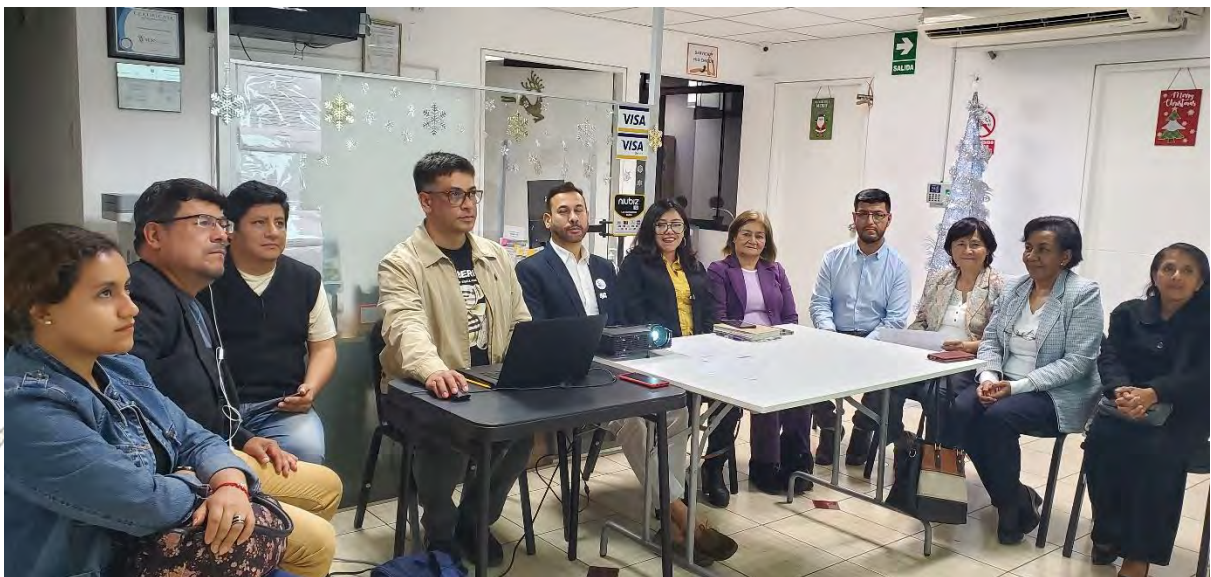
Reunión presencial ordinaria del CIEI INMENSA