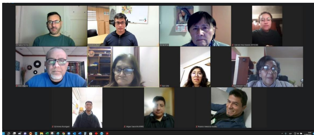
Reunión virtual ordinaria del CIEI INMENSA