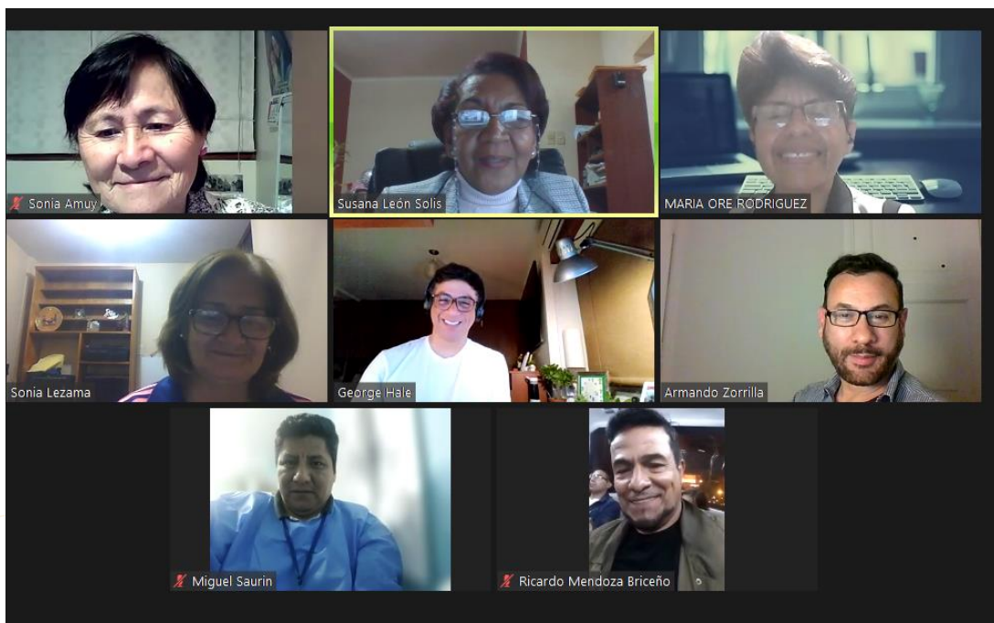
Sesión virtual del Programa de Capacitación en Metodología de la Investigación 2022